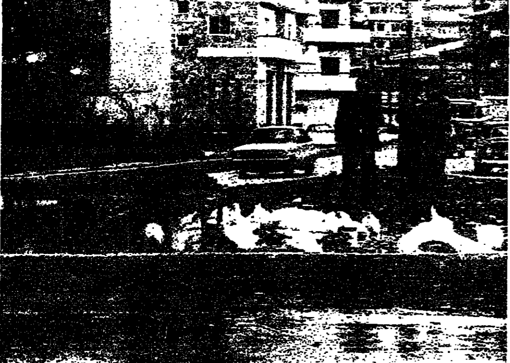
هذا بلدي وذاك نسل المزارع ■